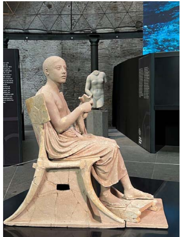
Foto 3: Orfeo e le sirene, IV sec. a.C., Museo dell'Arte Salvata, Roma