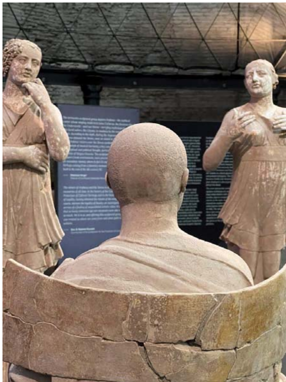
Foto 4: Orfeo e le sirene, IV sec. a.C., Museo dell'Arte Salvata, Roma