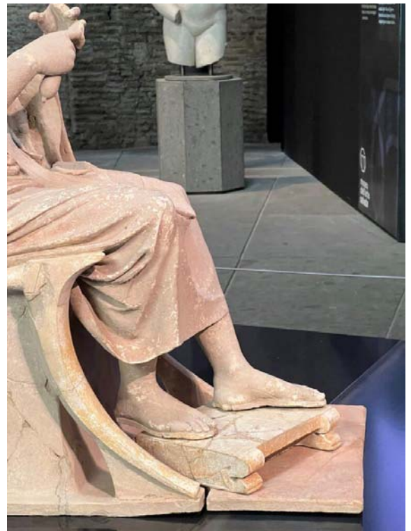
Foto 5: Orfeo e le sirene, IV sec. a.C., Museo dell'Arte Salvata, Roma

Da segnalare, riguardo al meraviglioso gruppo scultoreo, è anche l'attenzione che è stata data al suo allestimento all'interno dell'Aula Ottagona: lo spettatore lo vedrà al centro, valorizzato da un'illuminazione studiata ad hoc da Francesco Murano – tra i più importanti illuminotecnici italiani – per esaltare ogni figura.