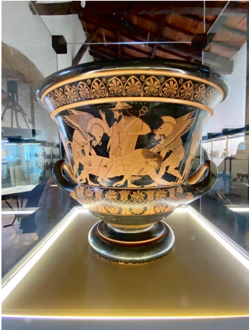
Foto 6: Cratere attico a figure rosse, firmato da Euxitheos come ceramista e da Euphronios come ceramografo, 510-500 a.C., Museo dell'Arte Salvata, Roma

Si capisce, dunque, quanto il suo ruolo sia importante, soprattutto considerando che l'Italia è stata la culla, ricchissima, di civiltà e capolavori che hanno dettato veri e propri modelli di canoni estetici e artistici. (foto 6)