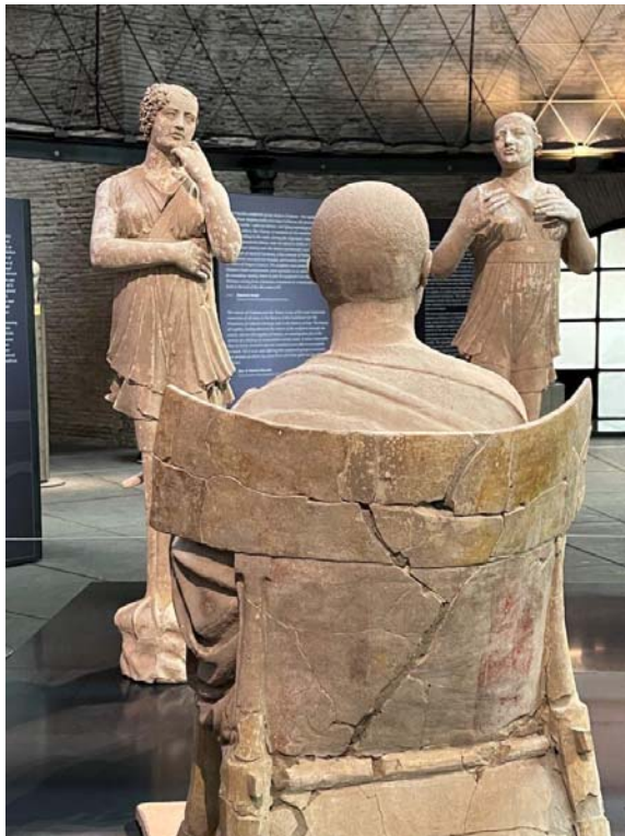
Foto 2: Orfeo e le sirene, IV sec. a.C., Museo dell'Arte Salvata, Roma